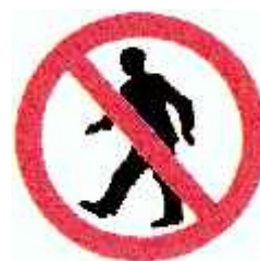
Průchod pro pěší zakázán