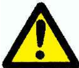
Varování, výstraha, riziko, nebezpečí