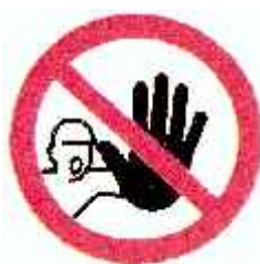
Nepovolaným vstup zakázán